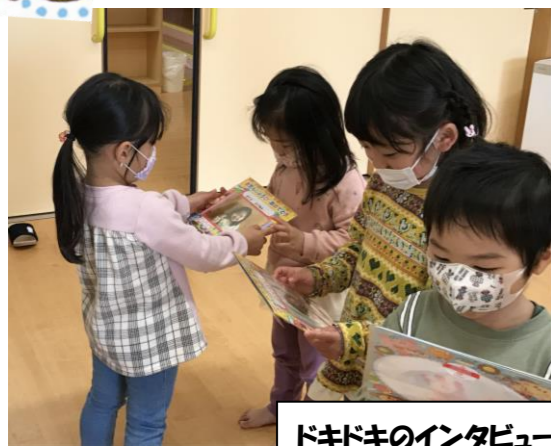
ドキドキのインタビュー! お友達からカードのプレゼントを もらいました