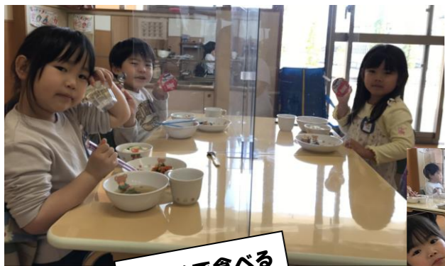
みんなで食べる お給食 おいしいね!