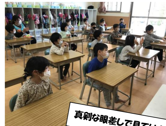
真剣な眼差しで見えています