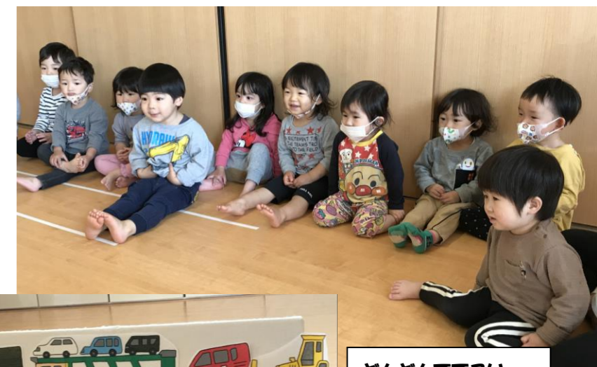
とんとんでこい はたらくるま〜