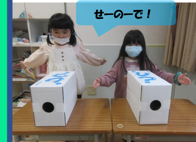
だれのかみコップがいちばんとんだ？