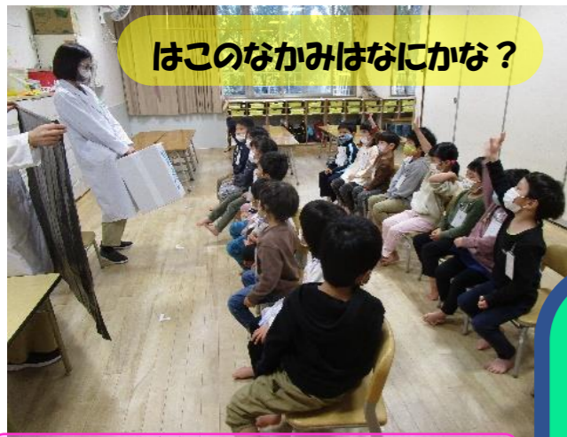
はこのなかみはなにかな？