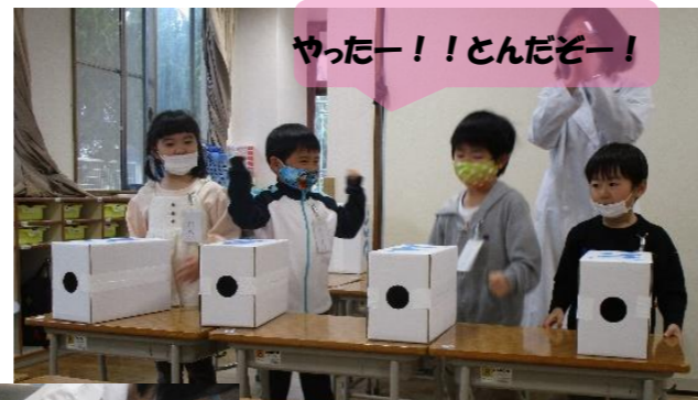
やったー！！とんだぞー！