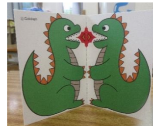
★きょうりゅうのまど★