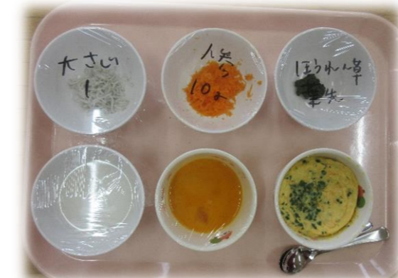
簡単レシピ紹介 「レンジでオムレツ♡」