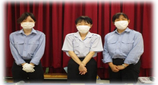
交通安全教室 3名の指導員さん