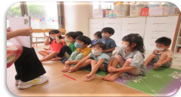
くま組・ぞう組さんには、交通安全の紙芝居を用意してくれました☆