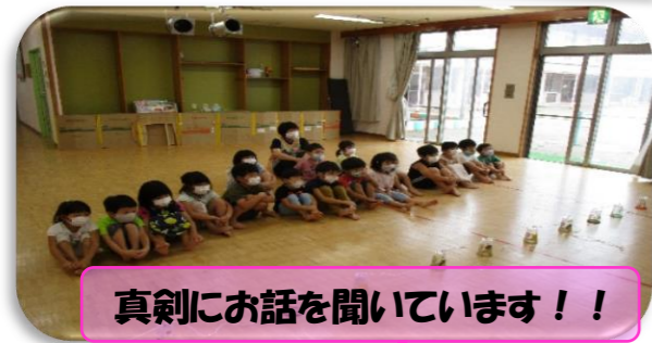
真剣にお話を聞いています！！