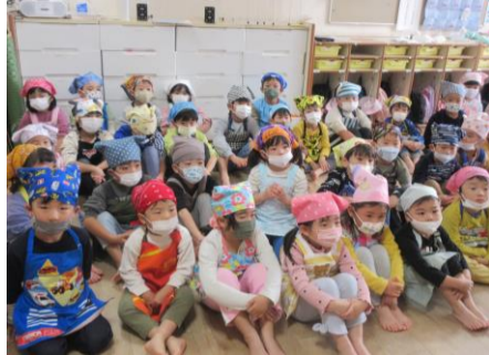
「手はいつもピカピカに！★」