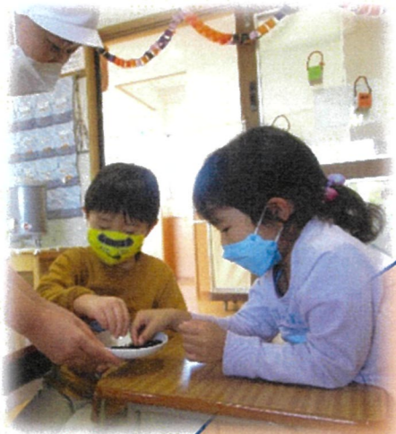
色々なお米があるんだね