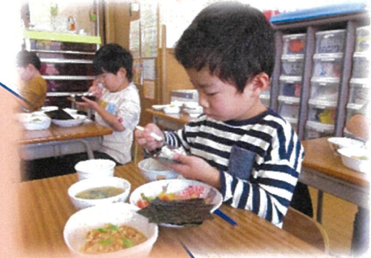
手巻き寿司作りスタート

らいおん組は手巻き寿司作りに挑戦しました。 具材はカニかまぼこ、ツナ、きゅうり、マヨネーズ、厚焼き卵。 おうちで作ったことがある子もいれば、初めて挑戦する子も いて手巻きの楽しさを知ることができました。 組み合わせは自由自在。きゅうりだけにする子もいれば、全 部のせの子もいました。日本の食文化にふれ、食事に感謝で きる貴重な時間になりました。