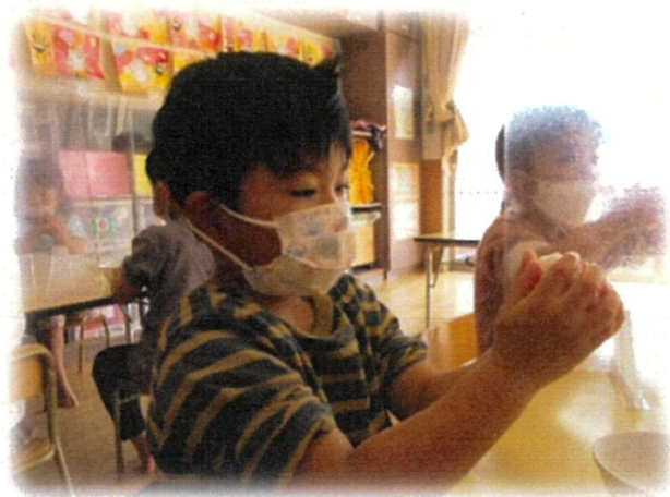
おにぎり作りスタート