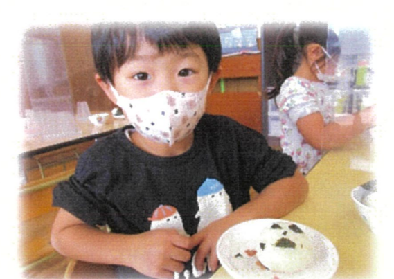
完成！ 美味しくできました