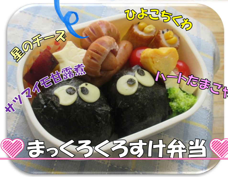
星のチーズ カツマイモ甘露煮 ひよこちくわ ハートたまご焼き