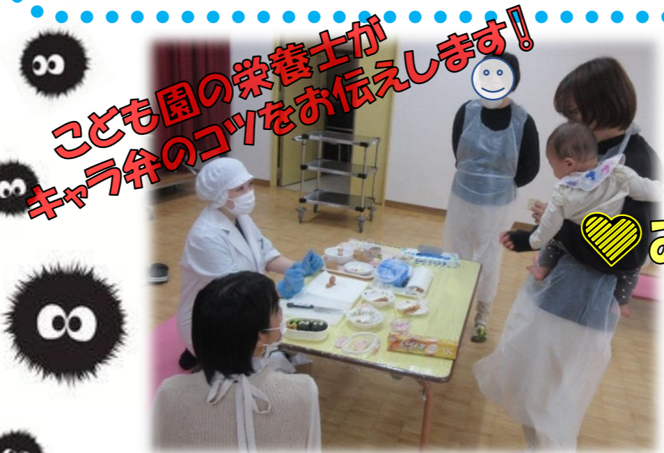
こども園の栄養士がキャラ弁のコツをお伝えします！