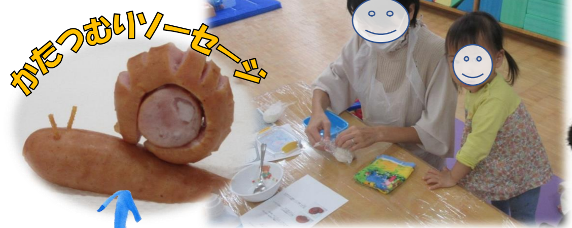
かたつむりソーセージ