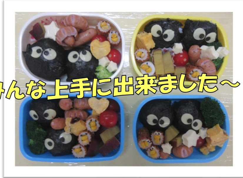
みんな上手に出来ました～♡