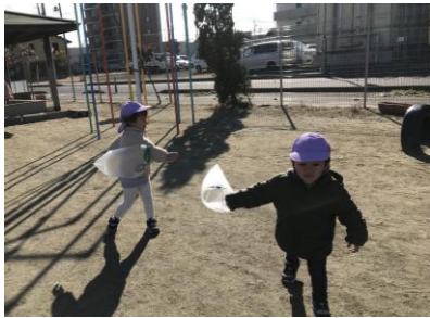
寒さに負けず、元気に走り、凧上げを楽しみました。

・1月は、主にお正月遊びや集団遊びを楽しみました。友達に「一緒に〇〇して遊ぼうよ」と誘い掛けたり、集団で遊びを共有したりと、友達に刺激を受けながら遊びを楽しむ姿が増えてきました。