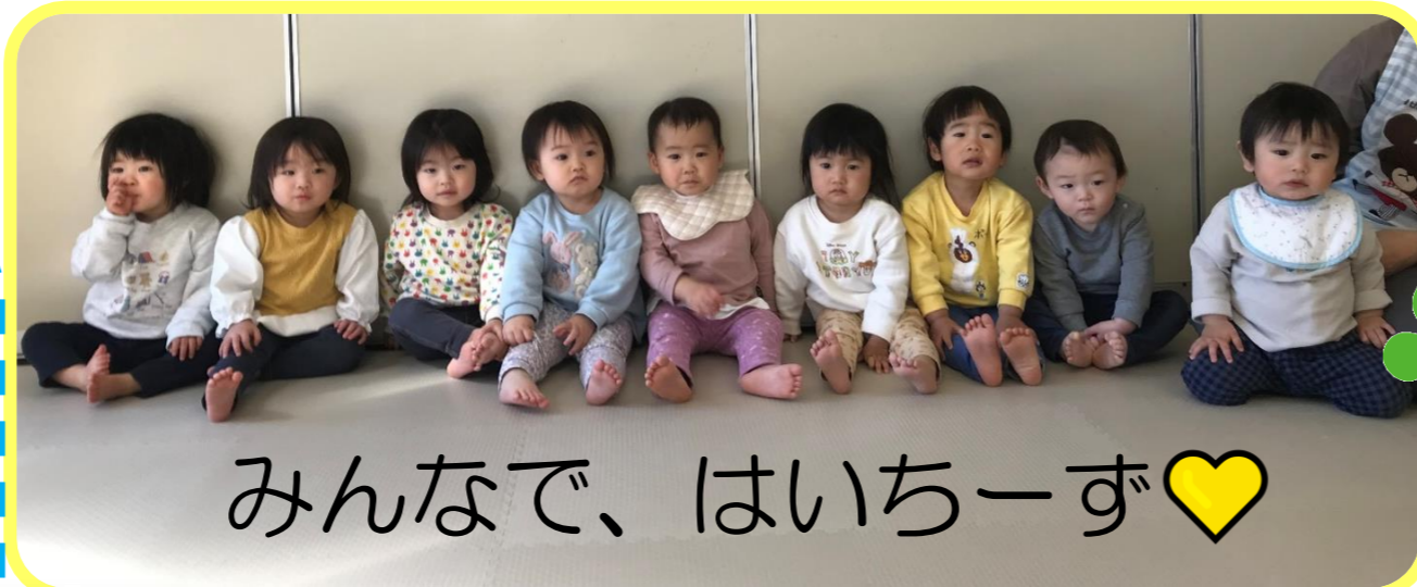
みんなで、はいちーず♡